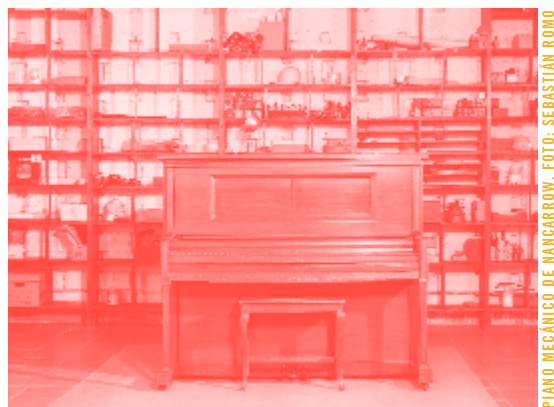
PIANO MECÁNICO DE NANCARROW.