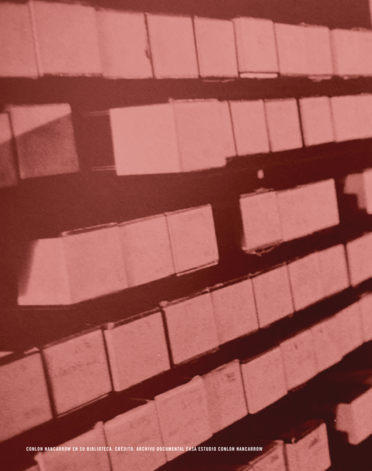
CONLON NANCARROW EN SU BIBLIOTECA.