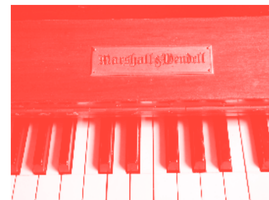
PIANO MECÁNICO DE NANCARROW.

Concierto estelar que ofrece, a lo largo del día y en uno de los espacios emblemáticos de la Casa del Lago, un ambicioso recorrido por los Estudios de Nancarrow en su versión original, mediante un piano mecánico muy semejante a los que tenía el propio compositor en su casa de Las Águilas.