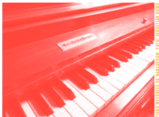
PIANO MECÁNICO DE NANCARROW.